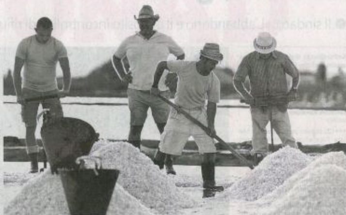
Salinari impegnati nella raccolta

gioga dei bassi fondali del mare e della intensa salinità delle acque. Due prodotti che ben si sposano con la riserva naturale orientata delle saline di Trapani e Paceco, scenario suggestivo e di notevole rilevanza naturalistica, dove il sale viene raccolto ancora oggi con metodi tradizionali e preziose specie vegetali ed animali come gli eleganti fenicotteri rosa, affollano le vasche delle saline insieme a tante altre varietà migratorie e nidificanti. Durante la due giorni dell'evento sarà possibile visitare, su prenotazione ( www.rossoaglio.it ), alcuni dei luoghi più interessanti per fauna e flora dell'oasi WWF oltre al Museo del sale il cui ingresso resterà gratuito. Pezzo forte della manifestazione, la tradizionale e suggestiva raccolta del sale al tramonto, con i canti dei salinai, che si svolgerà ogni giorno con inizio al tramonto e chiusura in notturna ed alla quale sarà possibile assistere. Il